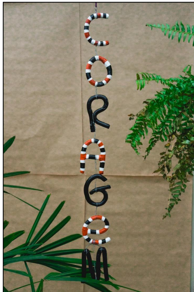
PÓVOA, Bia. Coragem. 2021.

“... Em meio aos barulhos Convide-a para entrar Que ela nos acompanhe Ilumine os caminhos... Nos dias felizes suas raízes crescem. Nos dias difíceis, respira Alimente seus sonhos Ajuda a encontrar o que procuramos Seu propósito te $$aguarda$$ Tenha Coragem > Py'aguasu” AnaV / 2021